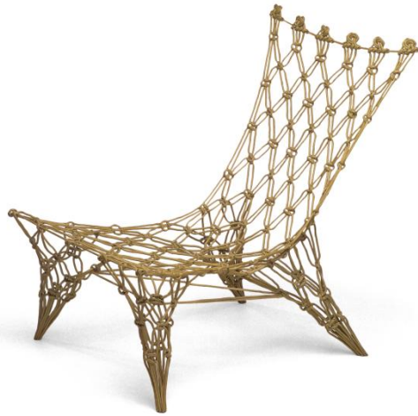
Marcel Wanders, Knotted Chair (prototype no. 5), 1995-1996, Collectie Stedelijk Museum Amsterdam.

Marcel Wanders werd beroemd met zijn ontwerp van de Knotted Chair (1995-1996) - onder andere aangekocht door het Stedelijk en het MoMA - voor het ontwerpplatform Droog. Droog is opgericht om Nederlandse ontwerpers van Dutch Design* in het buitenland te promoten. Wie met Droog samenwerkt, maakt vaak functionele ontwerpen die tegelijkertijd een commentaar vormen op de hedendaagse cultuur. Wanders past helemaal in deze lijn, met zijn nadruk op het persoonlijke en de gevoelswaarde van een object. Zoals de ontwerper in de uitzending zelf aangeeft, is 'vorm versus functie' een van de grote dogma's* in design.